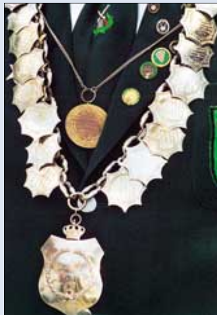
Der Tückinger Schützenverein 1872 e.V. brachte zum Fototermin die jetzt 54 Jahre alte Vereinsfahne mit. Die alte Königskette wurde 1950 erstellt; die neue stammt aus dem Jahre 1989. Die Königskette wurde in Abwesenheit des Königs vom Vorsitzenden Klaus Garthe mitgebracht.