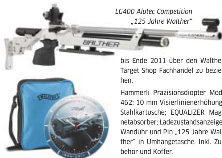
LG400 Alutec Competition „125 Jahre Walther“

Walther feiert in diesem Jahr 125-jähriges Firmenjubiläum und das wird natürlich gemeinsam mit den Kunden begangen. „Zu einem besonderen Ereignis muss es auch ein besonderes Gewehr sein“, so Walther und daher ist das aktuelle Spitzenmodell LG400 in einer hochwertigen Ausstattung und zu einem besonders günstigen Preis ins Angebot genommen worden. Das Sondermodell ist in limitierter Stückzahl aufgelegt worden und exklusiv nur