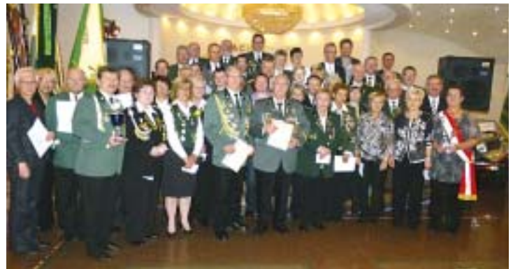
▲ Die Kreismeister 2011 im Schützenkreis Minden mit ihren Urkunden und Pokalen.