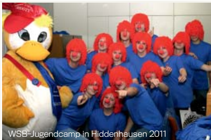
WSB-Jugendcamp in Hiddenhausen 2011

Infos: Hartmann Tresore AG, -Zentrale, Pamplonastraße 2, 33106 Paderborn, Tel. 05251 1744-0. Fax: 05251 17 44-999, www.waffenschraenke.de , info@waffenschraenke.de