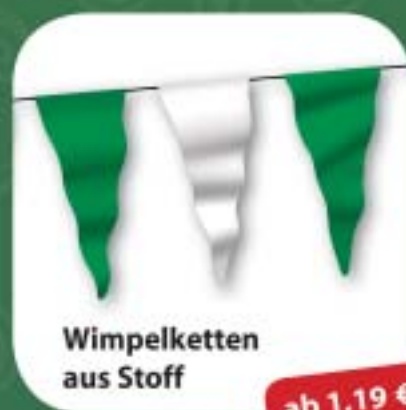
Wimpelketten aus Stoff