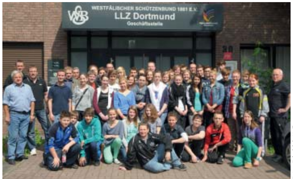
RWS Jugend/Juniorenverbandsrunde - Dieser Wettbewerb dient in erster Linie der Talentsuche und -förderung, und ist für die Teilnehmer ein Wettkampf auf hohem Niveau.