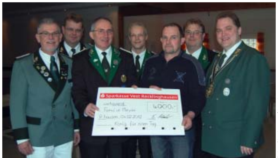
Schützenhilfe - Die Schützen mehrerer Recklinghäuser Gilden riefen aufgrund des Todes einer langjährigen Schützenschwester und Mutter von vier Kindern unter dem Motto „König für einen Tag“ gemeinsam zu einer Benefizaktion auf, die als Vogelschießen mit der Armbrust auf dem Schützenplatz der BSG Stuckenbusch-Hochlarmark II durchgeführt wurde.