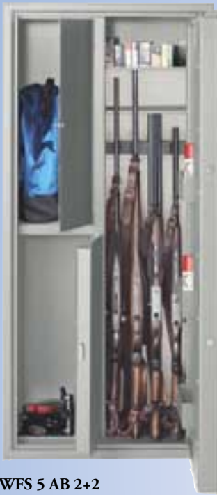
WFS 5 AB 2+2 Sicherheitsstufe A Munitionsf. A+B 150x67x46 cm Einstellhöhe 143 cm 207 kg 459,- €