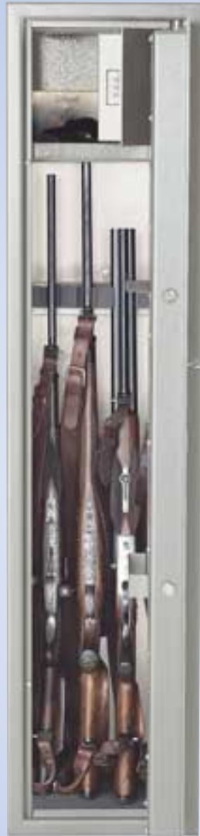
WFS 5 AB Sicherheitsstufe A Munitionsf. B 150x35x35 cm Einstellhöhe 120 cm, 105 kg 335,- €