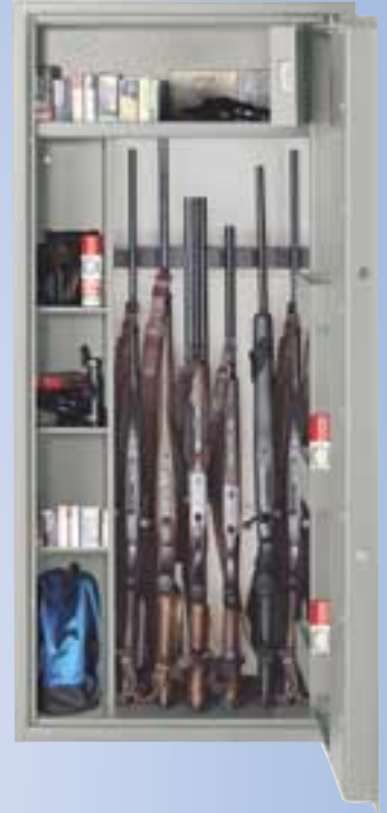
WFS 7 AB Sicherheitsstufe A Munitionsf. B 150x67x35 cm Einstellhöhe 119 cm 170 kg 427,- €