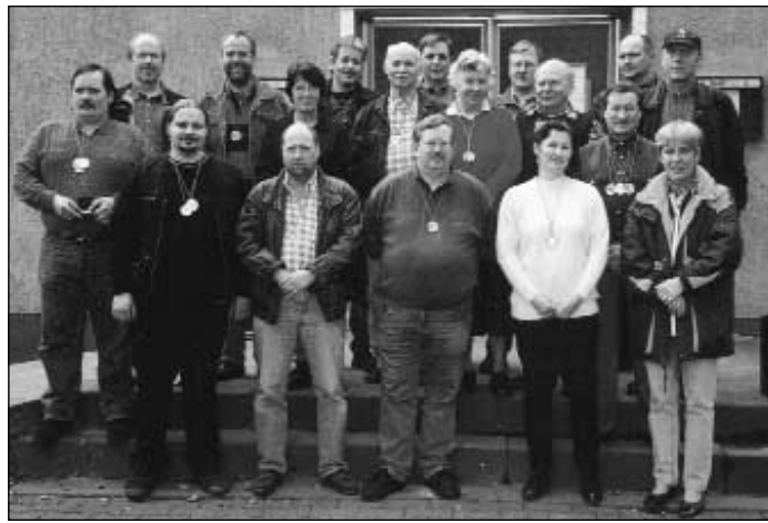
Die Erstplatzierten der Vorderladerschützen des Bezirks Industriegebiet.