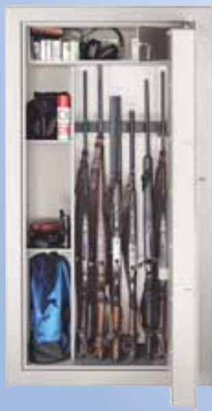
WFS 7 BA Sicherheitsstufe B, Regal für Ordner u.ä., Munitionsf. A, 150x80x45 cm, Einstellhöhe, 119 cm, 208 kg 529,- €