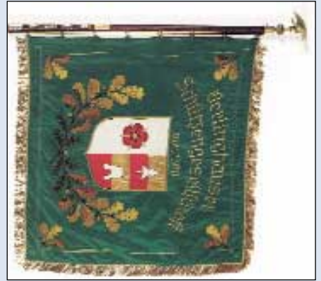
Von der Oerlinghauser Schützengesellschaft 1590 e.V. wurde eine Fahne vorgeführt, die 1990 gefertigt wurde. Darüber hinaus stehen uns Fotos von der alten Fahne aus dem Jahre 1955 zur Verfügung und außerdem Bilder von einem echten Kleinod, der ältesten Fahne des Vereins von 1852. Die Königskette von 1843 wird vom Schützenkönig Roland Koch vorgestellt.