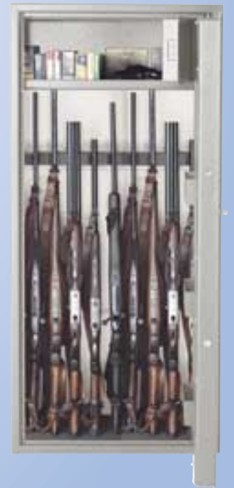
WFS 10 AB Sicherheitsstufe A, Munitionsf. B, 150x67x35 cm, Einstellhöhe 119 cm 165 kg, 415,- €