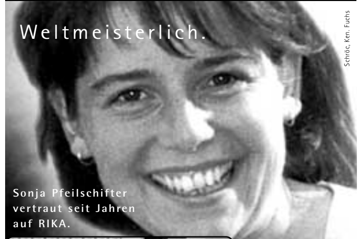
Schöbc. Ken. Fuchs