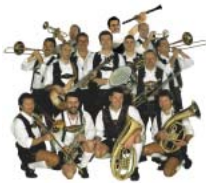
original bayrische Showkapelle

eine, die an diesem Event teilnehmen möchten, sind noch bis Ende Februar gute Karten reserviert! All das, was Stadtlohn bietet, sind ideale Voraussetzungen für ein gutes Gelingen des 63. Westfälischen Schützenfestes. Der Schützenkreis Ahaus, die St. Georgius Schützengil-